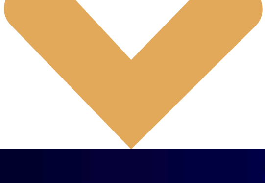
TABLA DE CALEFACCIÓN