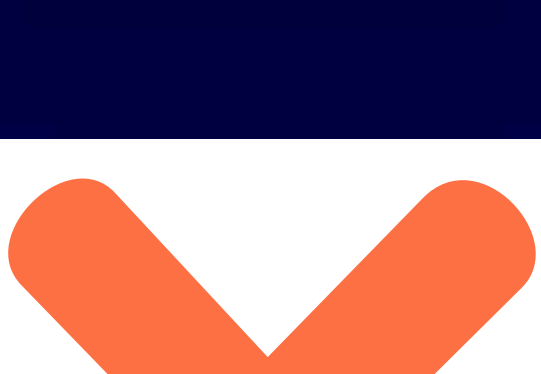
TABLA DE CALEFACCIÓN